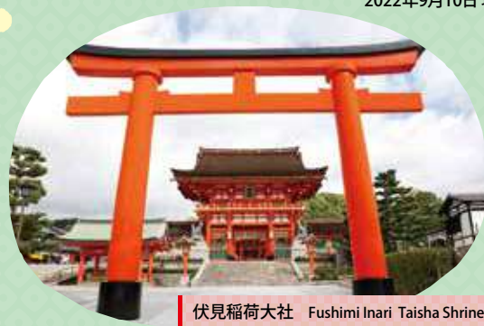
伏見稲荷大社 Fushimi Inari Taisha Shrine