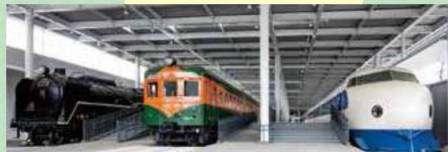
京都鉄道博物館 Kyoto Railway Museum