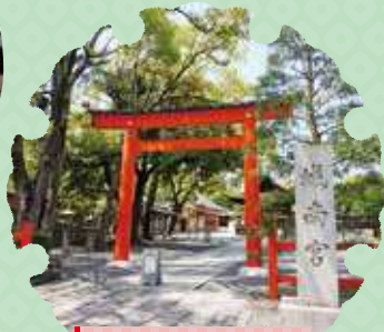
城南宮 Jonangu Shrine