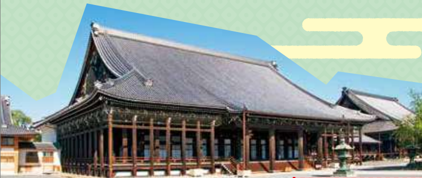
西本願寺 Nishi-Hongan-ji Temple