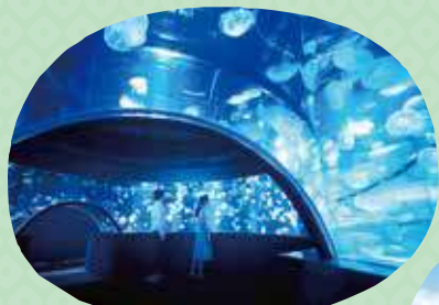
京都水族館 Kyoto Aquarium