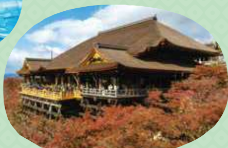
清水寺 Kiyomizu-dera Temple