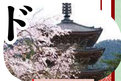
醍醐寺 Daigo-ji Temple