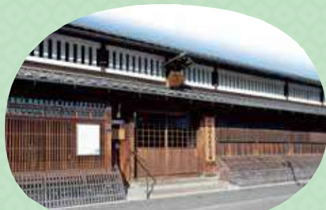
月桂冠大倉記念館 Gekkeikan Okura Sake Museum