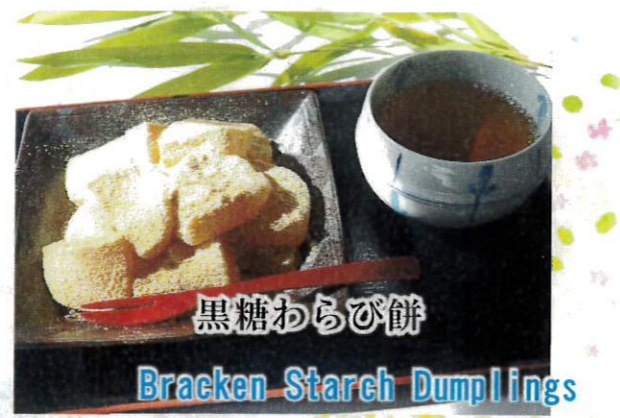
黒糖わらび餅 Bracken Starch Dumplings