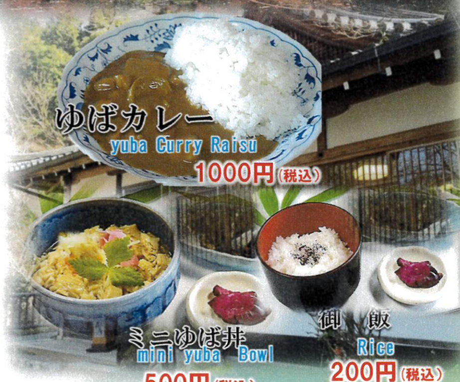
ミニゆば丼 mini yuba Bowl