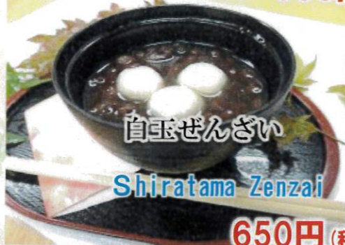
白玉ぜんざい Shiratama Zenzai