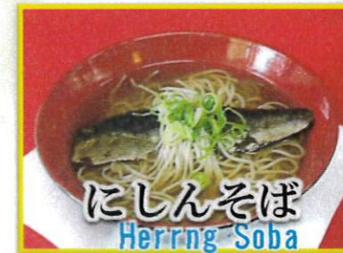
にしんそば Herrng Soba