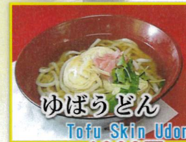
ゆばうどん Tofu Skin Udon