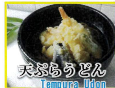
天ぷらうどん Tempura Udon