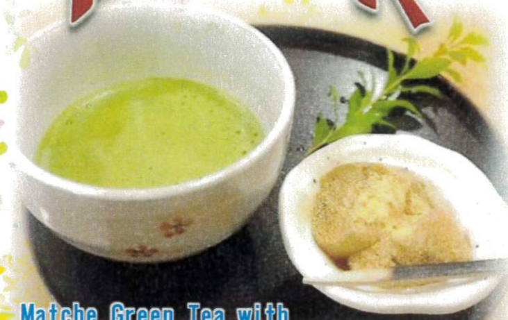
Matcha Green Tea with Bracken Starch Dumplings