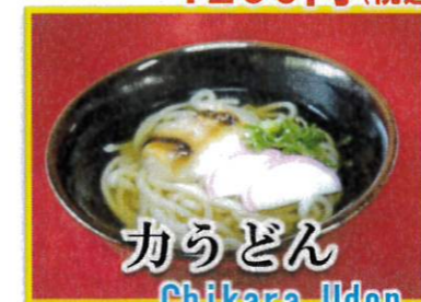
かうどん Chikara Udon