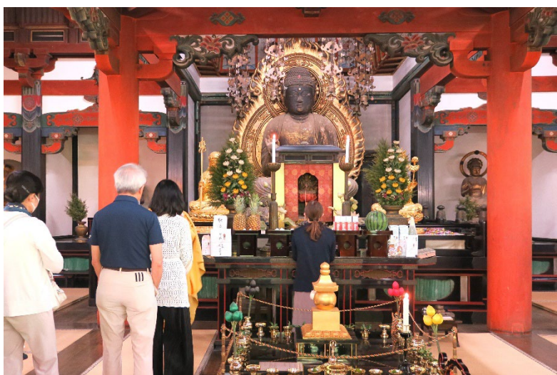
法要後准胝観音御前での参拝の様子