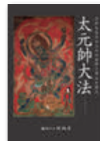
太元帥大法 パンフレット