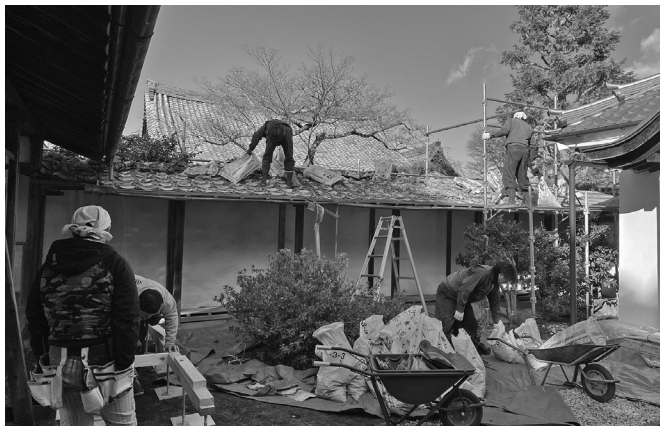
聖天堂渡り廊下屋根改修開始

詳細につきましては、改めてご報告申し上げますので、その際は、是非ご参拝ください。