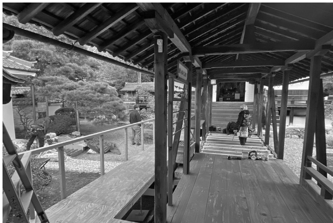
弥勒堂前渡り廊下改修開始