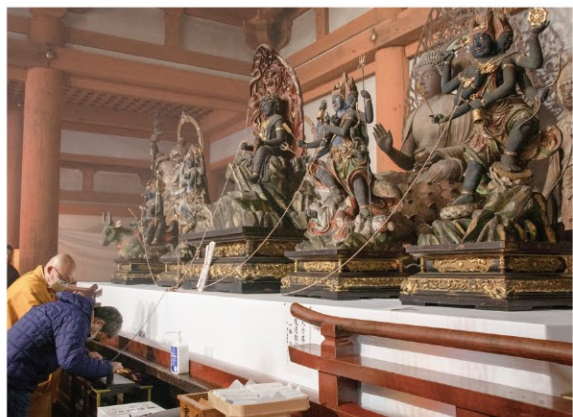
※実際は写真とは異なる場合がございます。